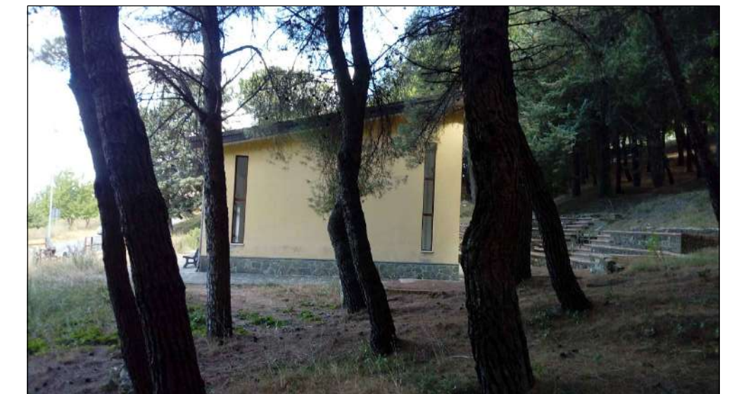
STRUTTURA POLIVALENTE: veduta sud dall'area a verde