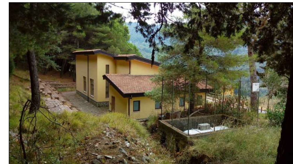
STRUTTURA POLIVALENTE: veduta nord-est dall'area a verde