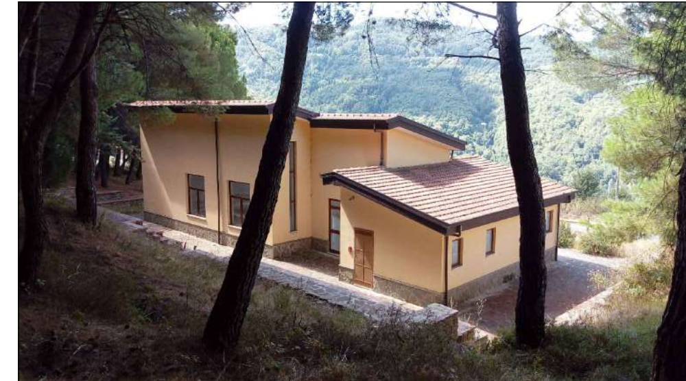
STRUTTURA POLIVALENTE: veduta est dall'area a verde