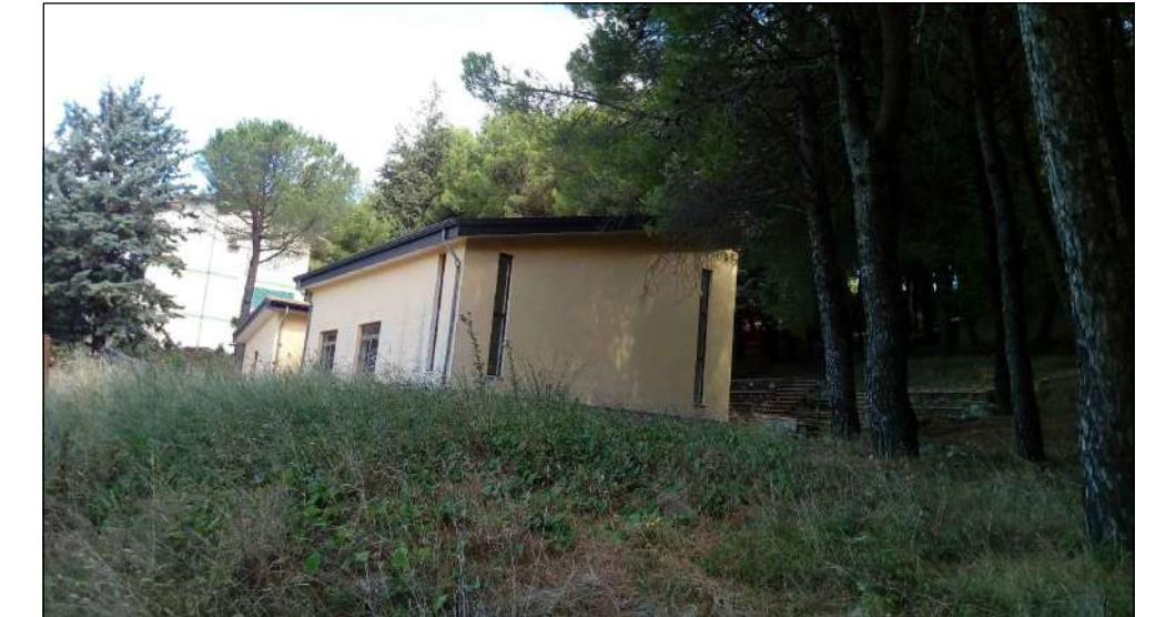
STRUTTURA POLIVALENTE: veduta sud dalla strada comunale