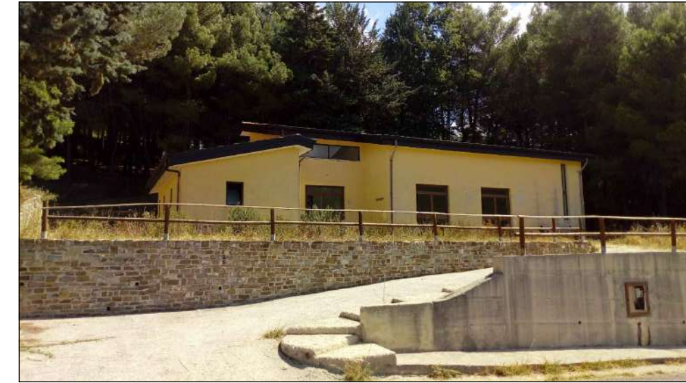
STRUTTURA POLIVALENTE: veduta ovest dalla strada comunale