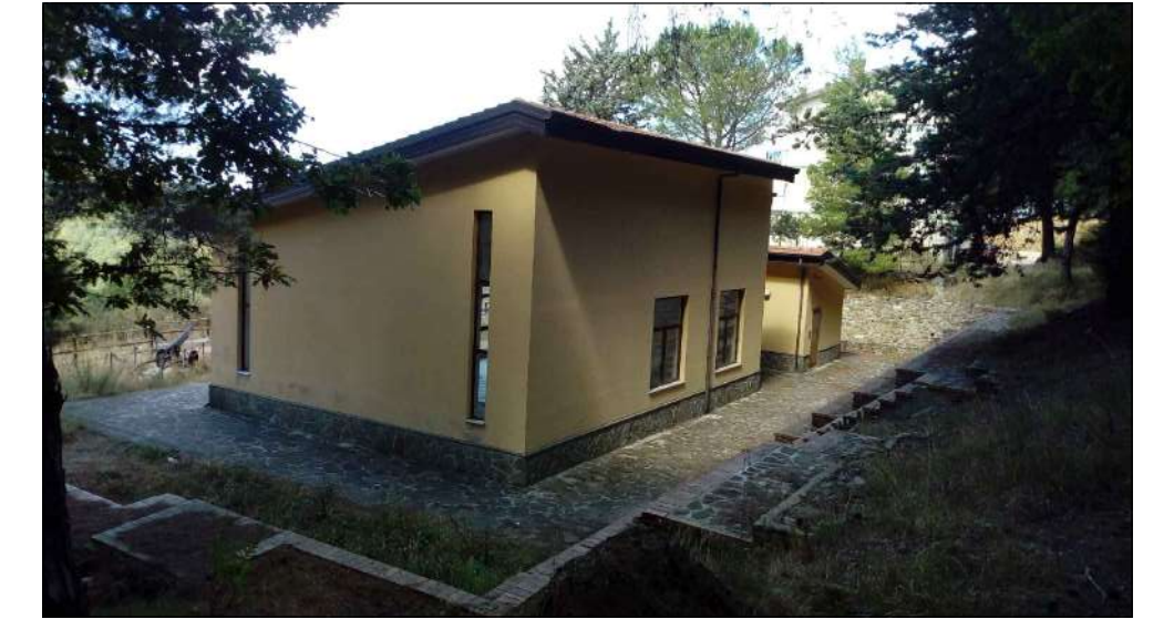
STRUTTURA POLIVALENTE: veduta sud-est dall'area a verde