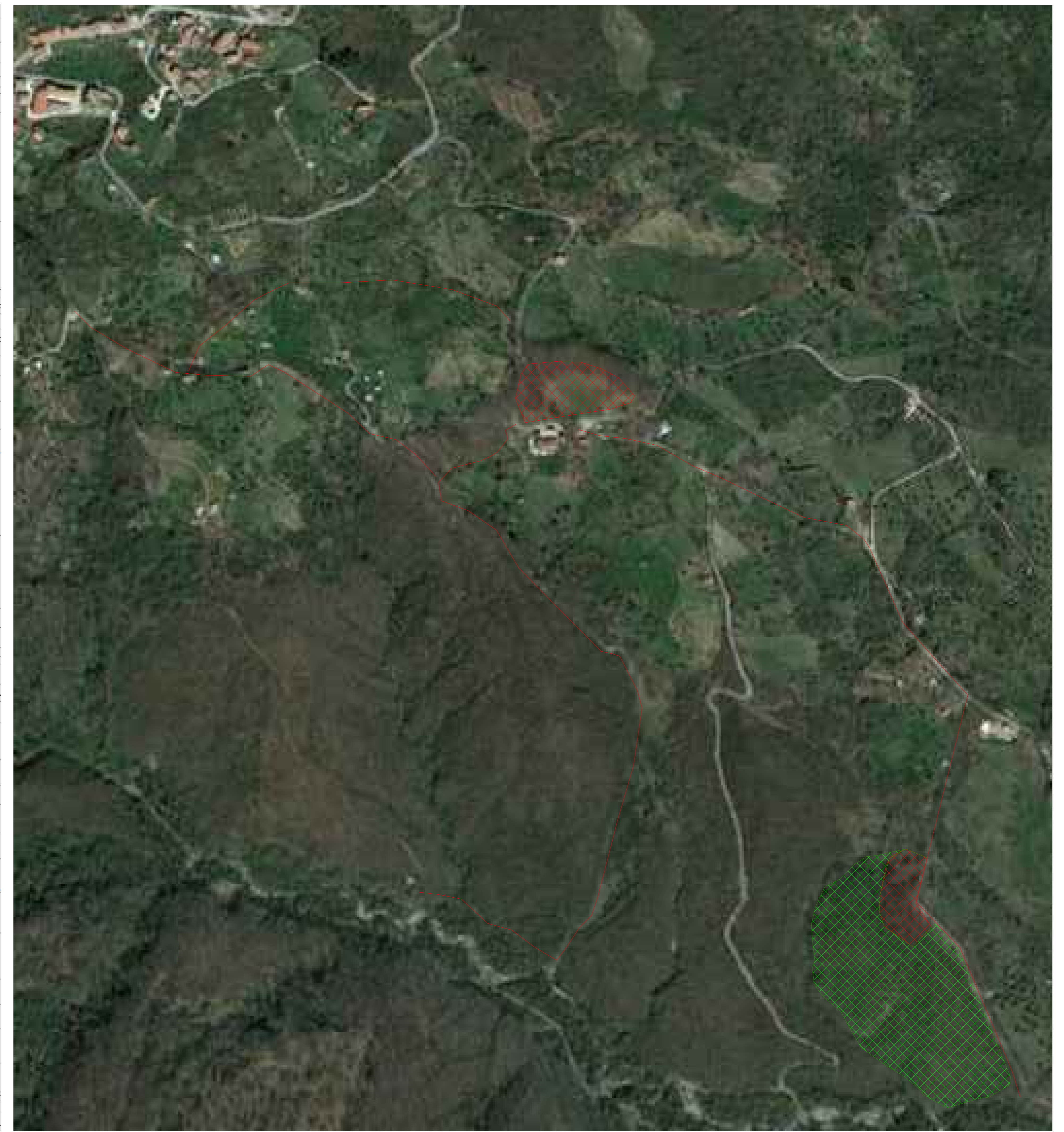
ORTOFOTO CON UBICAZIONE DEGLI INTERVENTI - SCALA 1:2000